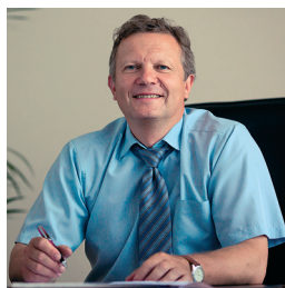
Сергей Тихомиров, президент Консорциума «Кодекс»

«Качественную медицинскую помощь пациенту обеспечивает целая система, начиная от лечащего врача и заканчивая как раз внутренним контролем качества в лечебном учреждении. Экспертиза оценивает как условия оказания услуг пациенту, так и их качество. Для этого на федеральном и региональном уровнях могут создаваться специальные комиссии, которые определяют критерии оценки, заказывают анализ работы медучреждения.