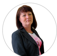
Обзор подготовлен экспертом службы поддержки пользователей систем "Кодекс"/"Техэксперт" Воробьевой Ольгой Владимировной

Ранее к сходным выводам приходил Арбитражный суд Дальневосточного округа (Постановление Арбитражного суда Дальневосточного округа от 19.02.2024 № Ф03-368/2024 по делу № А16-3370/2022).